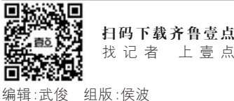
编辑：武俊 组版：侯波

怎样，世界就怎样”，就是通过奖励小而美的凡人善举，唤醒人心，激励善行，推动社会的光明和进步，用老百姓通俗的话讲就是“让好事随风传千里，让好人马上得好报”，至今已发放奖励金额9000多万元，有上万名各行各业的基层群众获得了奖励，这些普通人的故事成为人们学习和效仿的榜样，影响和带动着越来越多的人群。