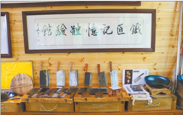
“匠心相公”金字招牌愈擦愈亮。

接筑保障。争取资金650万元用于12个村小型公益事业和产业项目建设。动态开展防返贫监测，发放产业收益13余万元，分类精准帮扶困难群众。代表章丘区迎接了全省年中检查和全市年底检查。