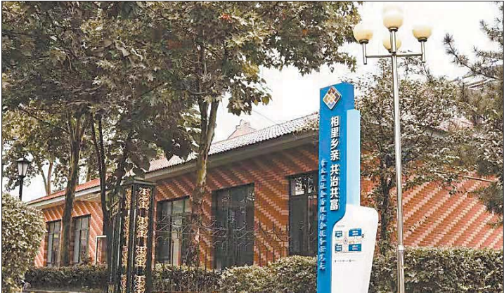
创建“相里乡亲”志愿服务品牌。

试点先行探新路。5个试点村项目全部建成达效，新增村集体收入282万元，其中群众分红156万元，探索出标准化厂房出租型、土地规模化托管型、农业项目化带动型等发展模式。土地托管强支撑。与鲁供集团合作，分两批完成了25个村1.8万亩土地托管，已有10个村新增收入254万元，群众分红后集体增收48.6万元。村企联建添动力。抓住“百企结百村”行动契机，年底全部村集体经济都将达到20万元以上，其中50万元以上的村占51.4%。有效衔