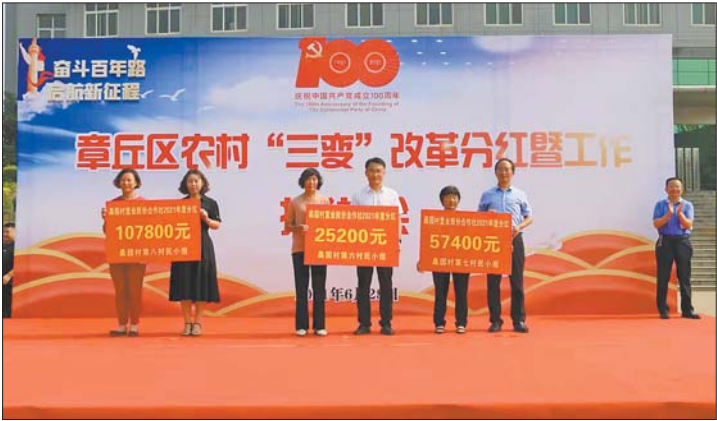
“三变”改革试点工作成效显著。