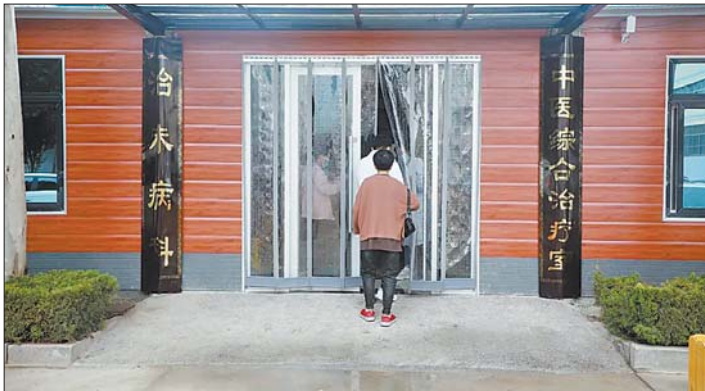
商河县中医院中医综合治疗室。