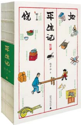
《平生记》 饶平如 著 广西师范大学出版社