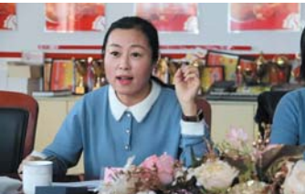
青岛市城阳区惜福镇街道牟家小学校长

2022年1月28日 星期五 晴 “五九六九，沿河看柳”，这几天的天气阳光明媚，如春天般温暖。