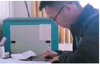
临沂市沂南县岸堤镇第一初级中学教师

2022年2月10日 星期四 晴 我自1999年毕业以来，扎根乡村教学23年，没有放弃一个学生。家访工作是老师教育好孩子的重要助力。