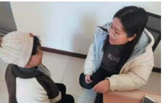
临沂市沂南县依汶镇朱家里庄中心小学教师

2022年2月8日 星期二 晴 每个孩子都是一颗会发光的星星，有些星星闪烁着耀眼光芒，有些星星光芒微弱。尽管如此，每颗星星都有着自己的运行轨迹，在浩瀚星河中有着自己独一无二的位置。