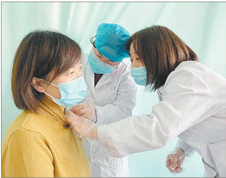
现场为患者解答在治疗过程中遇见的一些问题。