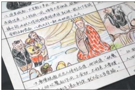
漫画作品《反西游记》