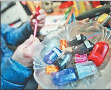
7年不停创作，转笔刀就用坏了十多个。