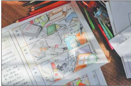
漫画《垃圾分类》作品一