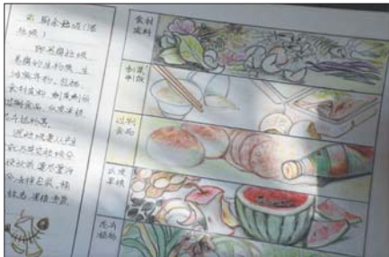
漫画《垃圾分类》作品二