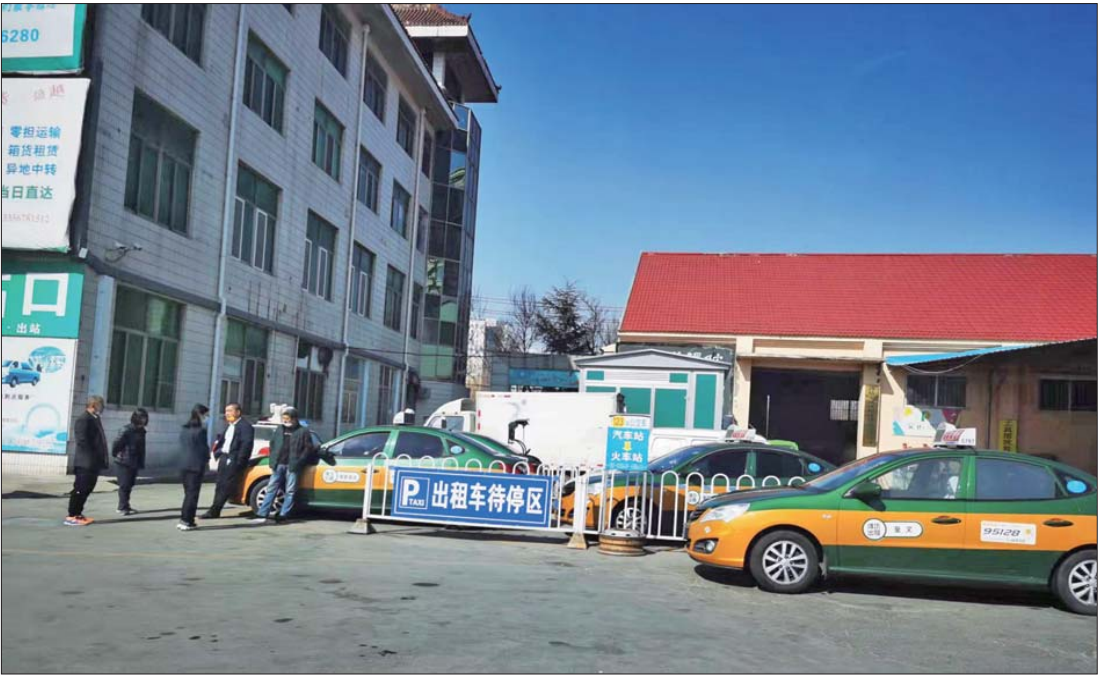
潍坊汽车总站紧挨着落客区开设了“出租车待停区”，只有少数出租车能进站候客。

1日上午11点，在潍坊汽车总站正门外的健康街上，出租车等候区里有十余辆出租车排着长队等待出站的旅客。而同时，汽车站正门的东侧，站场的车辆出入口处，陆续能看到有出租车从这里进出车站的停车场。 “这些从站场里面开出来的出租车都是交了费的，能直接把车开进去，停在大巴车下客的地方。”正门外候客的一位出租车司机介绍，以往，旅客从大巴车下来后，通过出站口来到汽车站大厅，再穿过大厅到达正门，然后从正门搭乘出租车离开。按照规定，出租车都排队等候在汽车站正门外，乘客从里面出来后，按照车辆先后顺序依次乘车。 “现在这种候客规律被打乱了。”这位司机说，两三天前，汽车总站在大巴车落客区设置了“出租车待停区”，允许少部分出租车开进站场内，停在这一区域内候客。 “听说每月交300元费用就能把车开进站场内，停在旅客下车的位置候客。”不少出租车司机证实了这一说法。 1日下午两点半左右，记者以旅客身份来到汽车总站了解情况，在汽车站站场内的西北角看到，墙体上写着“出站口”的字样，距离此处不远安装了一个四米左右的护栏，护栏上写着“出租车待停区”几个大字，两三辆出租车正停放在此处。出租车距离落客区不足十米，候客的司机也基本不坐在驾驶室，而是在车外面等待。 记者注意到，每当有载客客车进站停放在此处，乘客刚下车，出租司机就会围上来，询问