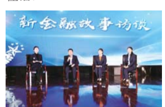
建行山东省分行三位不同条线的优秀代表上台畅聊新金融故事。

疫情防控,细节决定成败。新闻报道,角度烘托格局。突发事件面前,从一个平实的视角,用一段精细的呈现,成就一次建行人全心投入、共同抗疫的佳话。