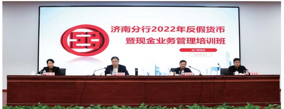
2月23日,工商银行济南分行举办2022年反假货币暨现金业务管理培训班,邀请人民银行济南分行营管部货币金银处领导现场授课。

该行还聘请外部专业培训公司高级讲师进行现场培训与指导,通过课件演示与人民币实钞现场教学相结合的方式深入浅出地进行讲解,使参训人员直观了解和学习反假币业务知识。培训后进行现场测试,参与反假实操考试通过率为100%,进一步保障培训效果。本次反假货币培训丰富了该行现金从业人员的反假货币业务知识,增强合规意识,规范假币收缴和鉴定行为,提升该行反假货币鉴定能力,建立并完善员工的反假货币培训档案,激发员工的学习和工作热情。从而为更好地履行社会责任、营造良好的人民币流通环境、提升现金服务水平,打下坚实的基础。