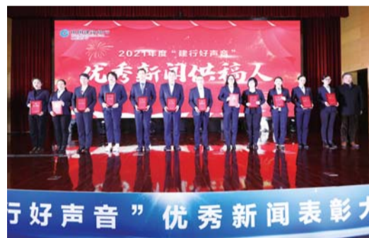
优秀新闻奖供稿人代表上台领奖。