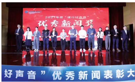
优秀新闻奖获奖代表上台领奖。

为进一步提高全行新闻宣传工作水平,全景式展示新金融发展成果和优秀新闻报道,建行山东省分行组织开展“建行好声音”优秀新闻展评活动,并于3月1日成功举办2021年度“建行好声音”优秀新闻表彰大会暨媒体恳谈会。