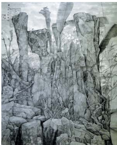
李晓兰 《南园群芳集会图》