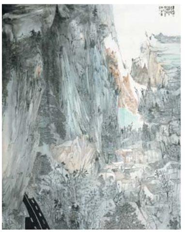
张洪漫 《梦绕仙乡游子吟》