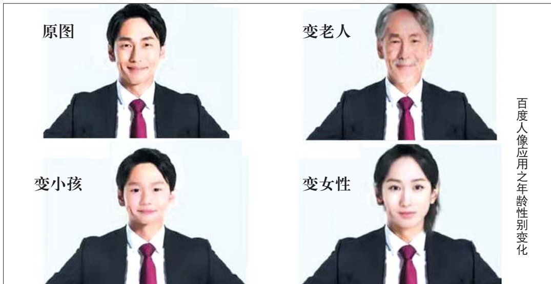
百度人像应用之年龄性别变化

美颜相机里还能DIY(自己动手制作)妆容,包括口红、腮红、眉毛、眼妆等,这是因为相机里植入了预先设计的不同风格的妆容模版,当人脸出现后,首先会基于人脸关键点,检测识别出特定部位,然后妆容模版会投射到人脸特定区域,最后妆容和原图进行高效合成。