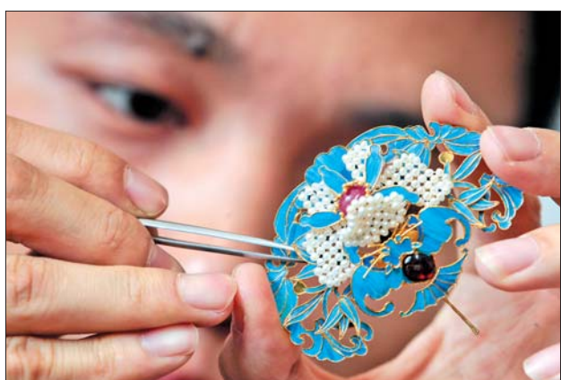
耐得住性子、沉得下心,是花丝镶嵌制作的前提。