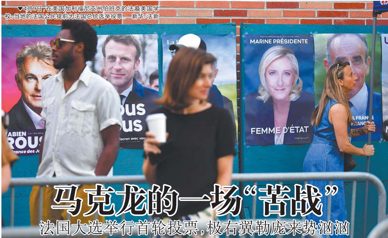
▼4月9日,在美国加利福尼亚州伯班克的法裔美国学校,当地的法国公民提前为法国总统选举投票。