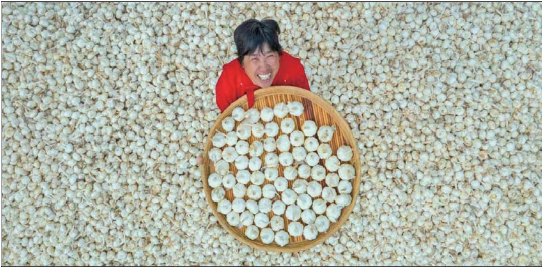
金乡蒜农喜获丰收。

因一颗小蒜头而享誉世界的金乡县,借助这个致富果,“一业活”带动“百业兴”。从“大蒜之乡”到“世界蒜都”,数十年间,造就了“世界大蒜看中国,中国大蒜看金乡”的美誉。