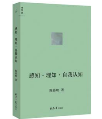
《感知·理知·自我认知》 陈嘉映 著 理想国 | 北京日报出版社