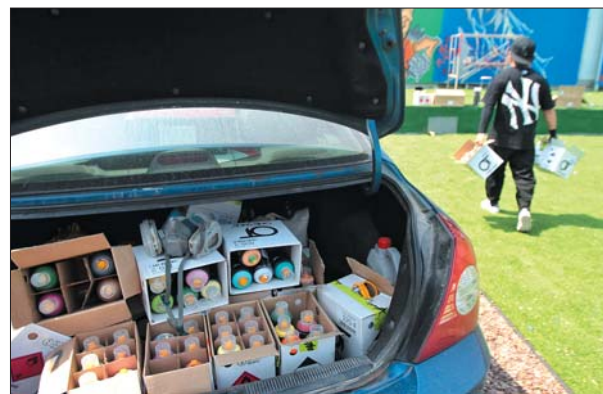
◀ 载着上百种颜色喷漆的汽车,就是毛毛的移动工作室。