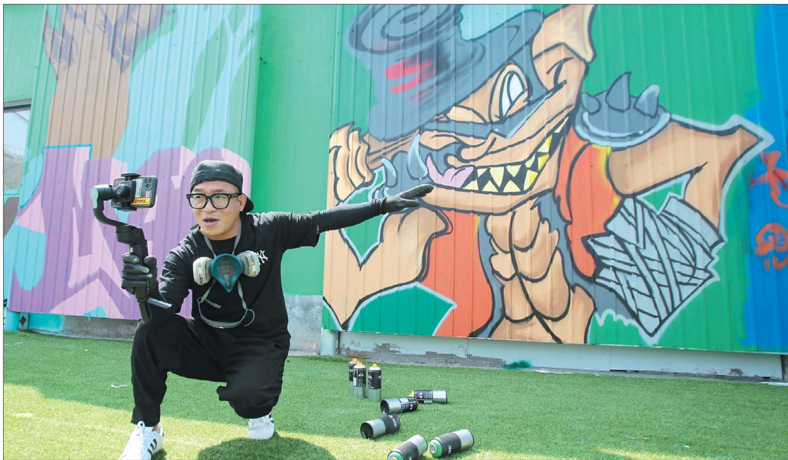
◀ 毛毛手机直播创作过程。