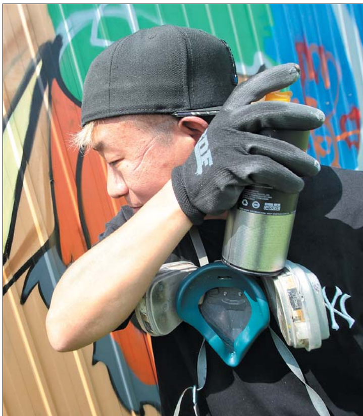
涂鸦时戴的防毒面具,不一会儿工夫就会在脸上留下一道道勒痕。

未来,他想留在家乡济南,他希望用最自由的方式释放灵感,在济南的一些公共场所创作出更具泉城特色的涂鸦作品,用这种新潮的艺术表现形式让更多外地游客了解济南文化,从而爱上这座城市。