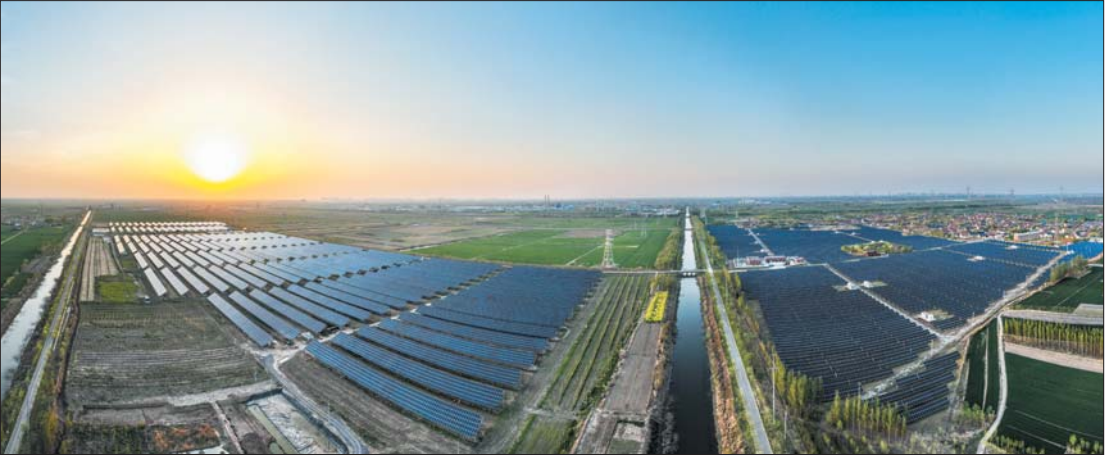
山东中硕农业发展有限公司农业现代示范园。