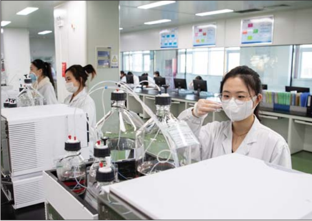
山东安舜制药有限公司实验室。