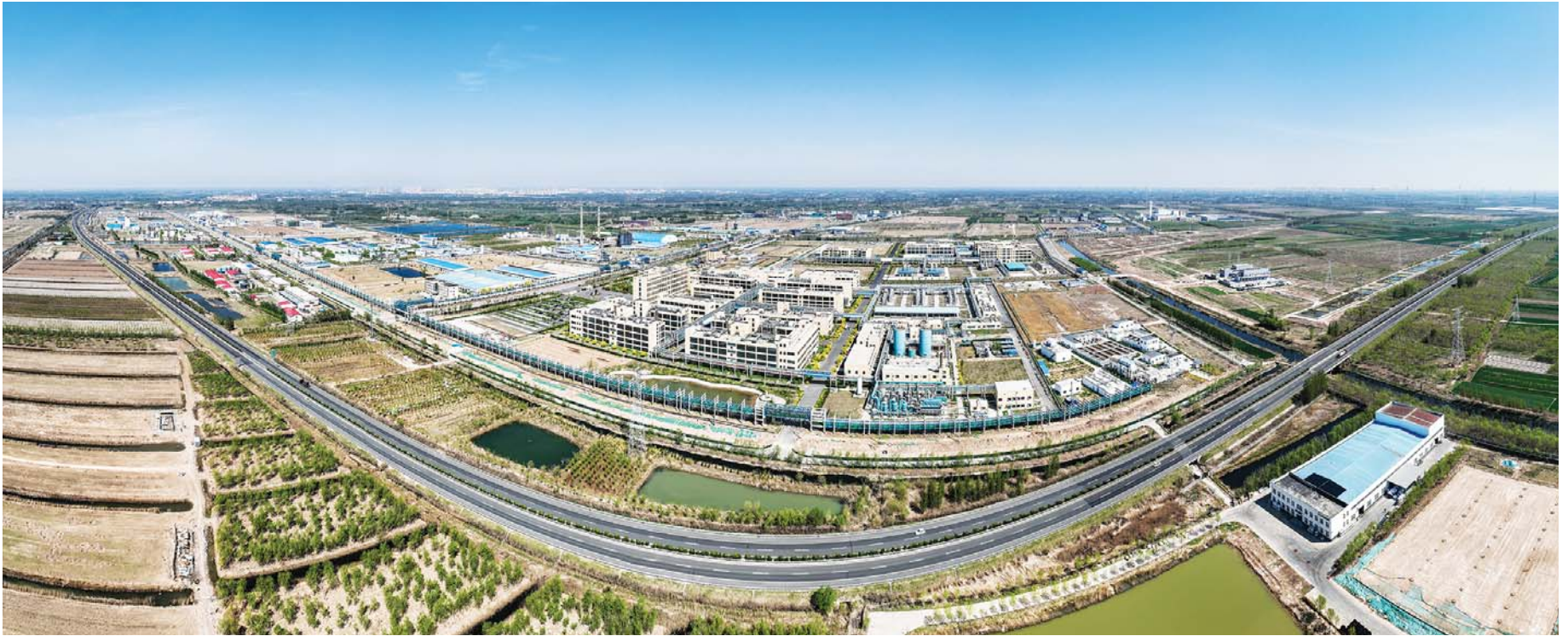
乐陵市循环经济示范园。