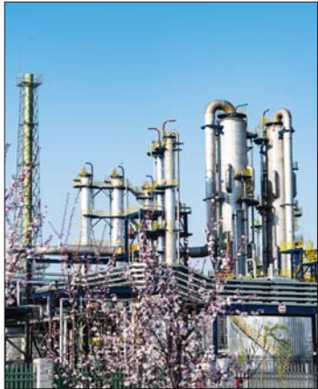
山东凯瑞英材料科技有限公司 脲基磺胺类医药中间体项目。

出乐陵市区南行5公里,有片11万亩的盐碱洼地,历史上曾是有名的“铁营大洼”。 “铁营洼,铁营洼,十年九载红荆花,涝了收蛤蟆,旱了收蚂蚱,不早不涝收盐嘎巴。”一首打油诗形象地描述了这片土地的贫瘠。 “不长庄稼,干脆让它‘长’企业、‘长’产业!”换个思路是出路。 2009年11月,借势国家“蓝黄”战略的实施,“铁营洼”有了新名字:乐陵市循环经济示范园。 机声隆隆唤醒了长睡的大洼,盏盏电灯照亮了大洼久暗的夜空。乐陵先后编制了总体发展、产业发展、安全风险等“六大规划”,充分挖掘这片荒碱低效未利用土地的潜力,确定了打造“千亿级智慧园区”的发展方向。 在乐陵化工产业园智慧园区指挥中心,记者看到,园区生产经营状况一目了然,特别是安全环保实行无死角、24小时实时监控。历经12年的发展,这个规划面积20.1平方公里的化工产业园,累计投资90亿元完成“九通一平”区域13.5平方公里,建成创新创业中心、消防中心、固废危废处置中心和智慧园区指挥中心“七中心一平台”,吸引47家企业入驻。 2017年,乐陵成功获批德州市第一批化工园区,乐陵循环经济示范园又添了新名字:乐陵化工产业园。