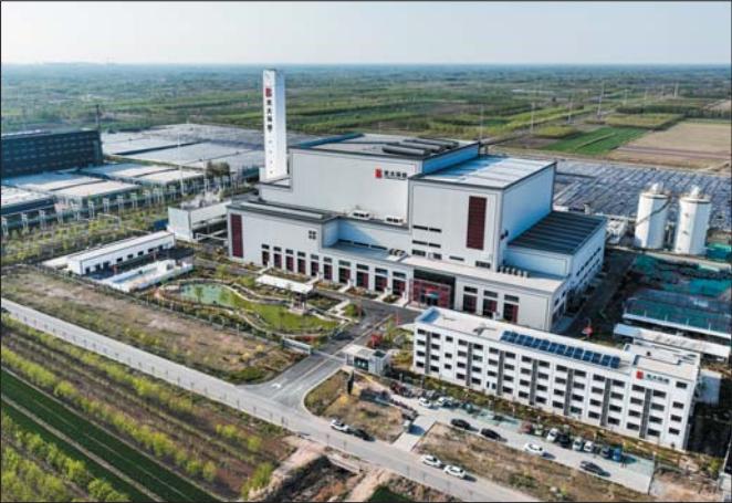
乐陵光大环保能源有限公司生活垃圾焚烧发电项目。