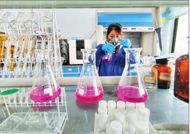
德州正朔环保有限公司实验室。