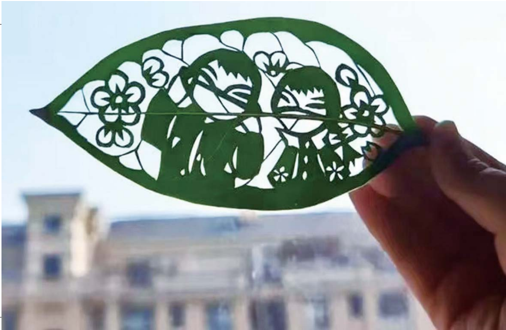
学生在树叶上巧手作画。

据了解,该《方案》的出台在全国尚属首例。与2021年3月出台的《济南市加强中小学劳动教育行动方案》《济南市中小学家庭劳动教育清单》等制度相衔接,济南市在全国率先实现了基础教育层面劳动教育的“全学段、全链条”整体推进。