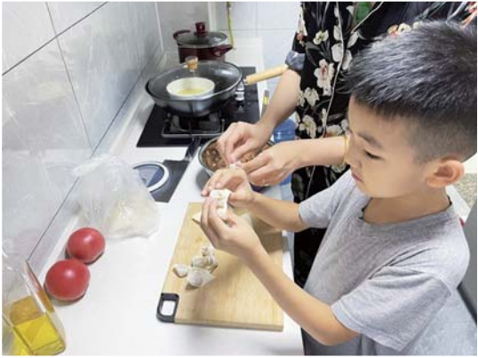
纬二路小学学生居家参与家务劳动。