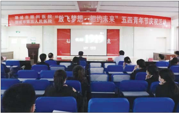
医院举办“放飞梦想 相约未来”征文颁奖和“五四”青年节观影活动。