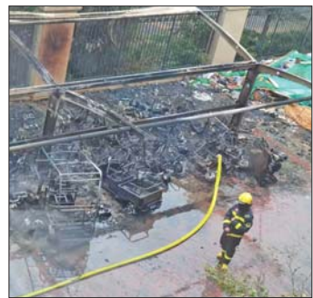
过火后的车棚。

9日上午,针对该起事故的原因,记者联系到该小区物业。“当时应该有辆电动车在进行充电,所以可能是电动车充电引起的。”一位物业工作人员说。随后,记者从消防部门获悉,该起事故的损失不大,但事故原因仍在进一步调查中。