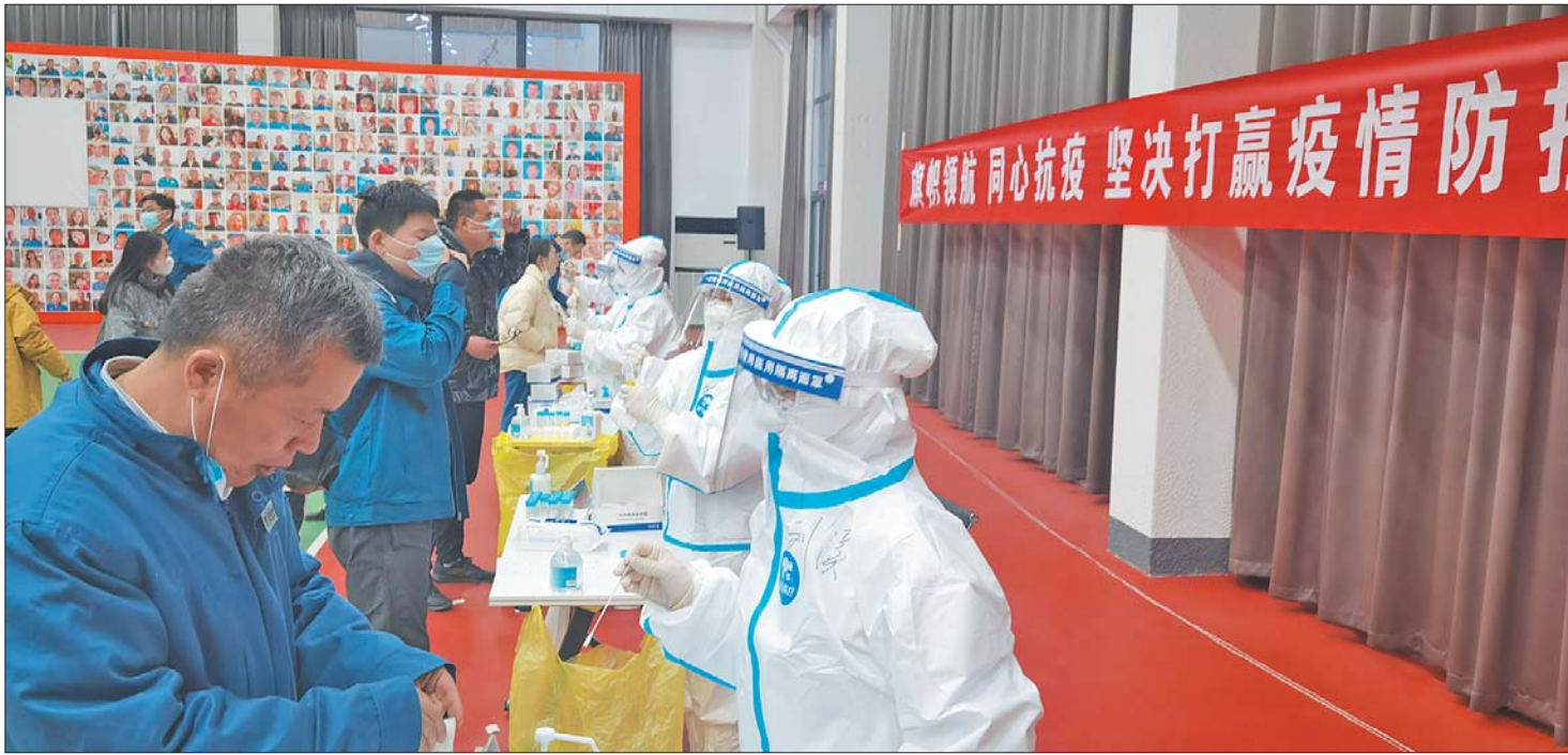
济阳区人民医院的“大白”们正在为市民做核酸检测。

3月初，滨州疫情形势严峻。一支由5名护士组成的核酸采样应急队踏上了支援滨州的征途。在邹平的日子里，她们常常凌晨集合，一次次入户、定点、下村庄，不时冒雨到村子里执行核酸采集任务，有防护面屏下被雨水浸透而冰冷的手，也有当地老人心疼的关怀和孩子的感谢，更有困极累极饿极时的坚持。13天，她们高质量地完成了16650次入户和定点采集任务，安全返回。