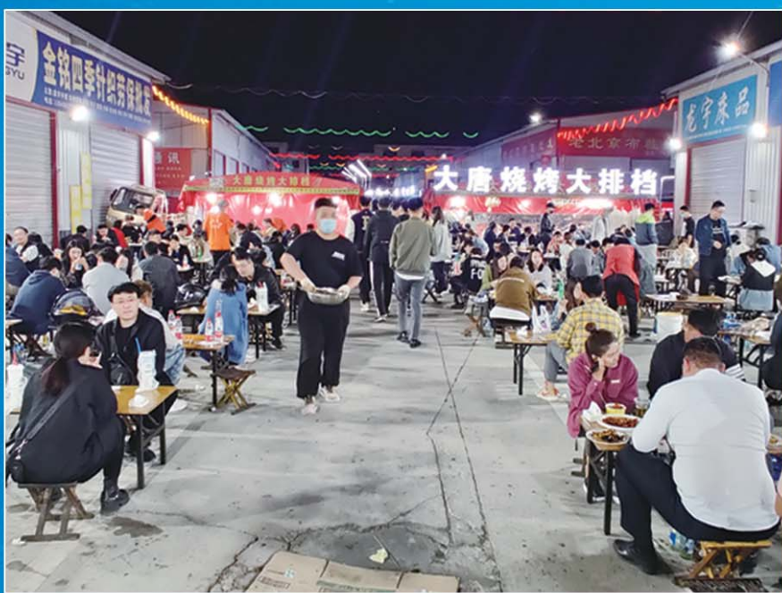
随着疫情防控形势好转,4月15日按下暂停键的济南最大夜市——环联夜市于5月13日晚恢复营业,不少市民赶来尝鲜。