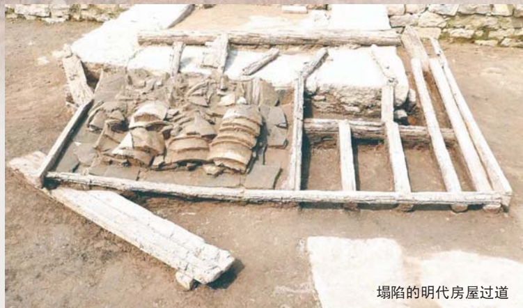
塌陷的明代房屋过道

明代的院落、灶台，唐宋时期的盘、碗、盏，汉代的水井……日前主体已完工的徐州城下城遗址博物馆计划近期开馆，厚达十余米的“城下城、街下街、井下井”的叠城奇观将立体地向观众呈现。古城徐州的重要特点之一，是自建城伊始，历代城址或因连绵战火或因水灾地震，致其深掩地下，风雨飘摇之下城址却未易其地。近年来，随着城市建设不断发展，这一叠城奇观渐显真容，历史的年轮就这样被呈现出来。