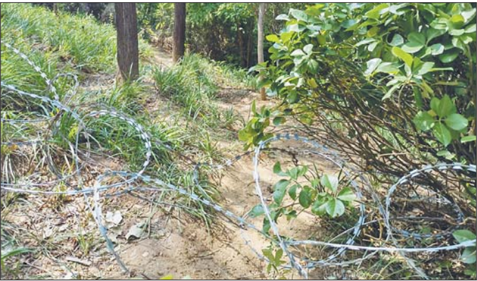
砚泉边的护栏网上被人扒开了一个大洞,旁边也有小道。