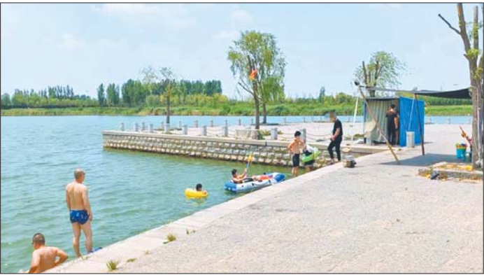
不少人在鹊山龙湖里游泳。

浆水泉水库因“七十二名泉”之一的浆水泉而得名。水库平均水深15米,最深处近30米。两边地形陡峭,水底多有乱石,底部呈V字形,此前曾多次发生过溺水事故。