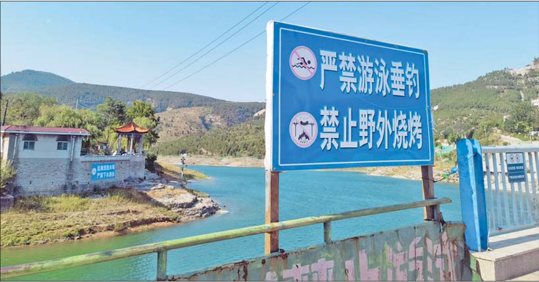
在浆水泉水库的不同区域,到处可以看到“严禁游泳”的牌子。

夏日天气闷热,很多人喜欢亲水以避酷暑。亲水固然酣畅,可危险也是无处不在。齐鲁晚报·齐鲁壹点记者探访济南多处危险水域发现,尽管指示牌上的“严禁游泳”异常醒目,还是有不少人野泳。