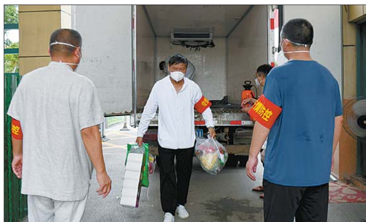
安徽泗县全力保障生活物资供应。

积居奇、捏造散布涨价信息、哄抬价格等扰乱市场价格秩序的违法行为。目前,全县面粉、大米、食用油等生活物资供应充足,除肉类、蔬菜价格略涨外,米面粮油价格总体稳定。