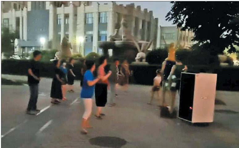
广场舞爱好者在跳舞时使用“神器”的效果明显。

刘延灏表示,在此之前,他们针对跳广场舞的场所、时间、音乐的音量等方面进行了严格的管理,但根据居民的反映,噪音问题虽有所缓解,但依旧没有达到预期的效果。针对这一情况,他们就转变了思路,朝对音源的控制方面下功夫。