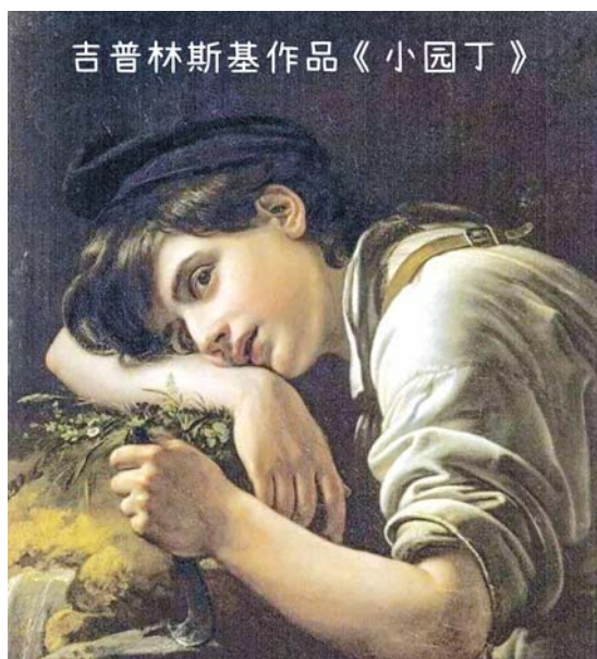
吉普林斯基作品《小园丁》