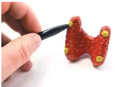
甲状旁腺四个黄豆大小腺体，就是甲状旁腺。

为解决患者结石反复发作的问题，济南市中心医院乳腺、甲状腺外科副主任医师金广超，率领团队和泌尿外科团队紧密配合，为患者制定了科学的治疗方案，先