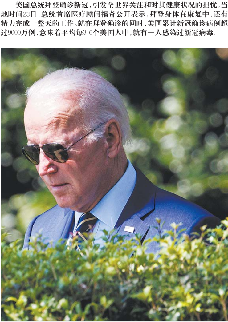
7月20日在华盛顿白宫拍摄美国总统拜登。

可能是BA.5毒株 美国白宫总统医生奥康纳当地时间22日说，日前确诊感染新冠病毒的拜登总统症状有所改善。奥康纳在一份备忘录中表示，初步检测结果显示，拜登感染的是奥密克戎变异株BA.5，但他的血氧饱和度正常，也没有呼吸急促的症状。 奥康纳在一份备忘录中说，拜登21日晚间低烧，服用退烧药后体温恢复正常，目前症状包括流鼻涕、疲劳及咳嗽。拜登对治疗耐受性良好，将继续服用治疗新冠感染的抗病毒口服药物奈玛特韦/利托那韦组合。 白宫21日上午通报说，拜登当天新冠病毒检测结果呈阳性，症状轻微。拜登此前已接种新冠疫苗以及两剂加强针，将在白宫隔离并继续全面履职。据美国公共广播电台报道，拜登将在白宫隔离到26日，若其届时新冠检测结果呈阴性，便可在次日恢复正常活动。 一段时间以来，多名拜登政府官员和美国国会议员确诊感染新冠病毒，包括副总统哈里斯、国会众议院议长佩洛西、国务卿布林肯、美国国家过敏症和传染病研究所所长福奇、司法部长加兰、商务部长雷蒙多、卫生与公众服务部长贝塞拉等。 疫情暴发以来，新冠病毒不断迭代，2021年底开始大规模传播的奥密克戎变异毒株目前已成为全球主导毒株，原始株BA.1和BA.2的传播主导地位很快被BA.4和BA.5取代。美疾控中心19日表示，在截至16日的一周内，该毒株的感染病例至少占全美新增病例的77.9%。专家表示，变异毒株BA.5造成的突破感染率很高，美国疫情防控面临严峻挑战。