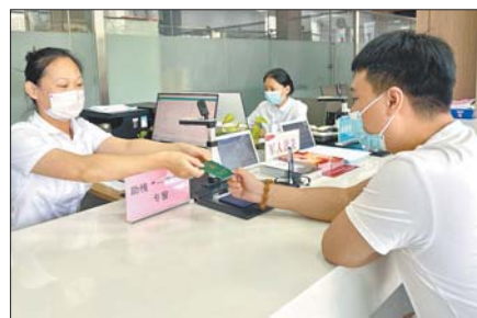
为民服务中心设有助残“一件事”服务专窗。

目前，济宁各县市区各级为民服务中心都已设立助残“一件事”服务专窗，实行一表申报、一站受理。自窗口上线以来已办理2134件，惠及群众2000余人，发放补贴300余万元，畅通服务残疾人的“最后一公里”。