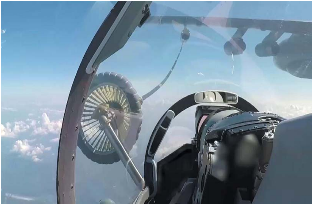
战区空军出动预警机、歼击机、加油机、干扰机等多型多批战机,重点组织了制空作战、空中加油、对海支援等演练。图为空中加油。