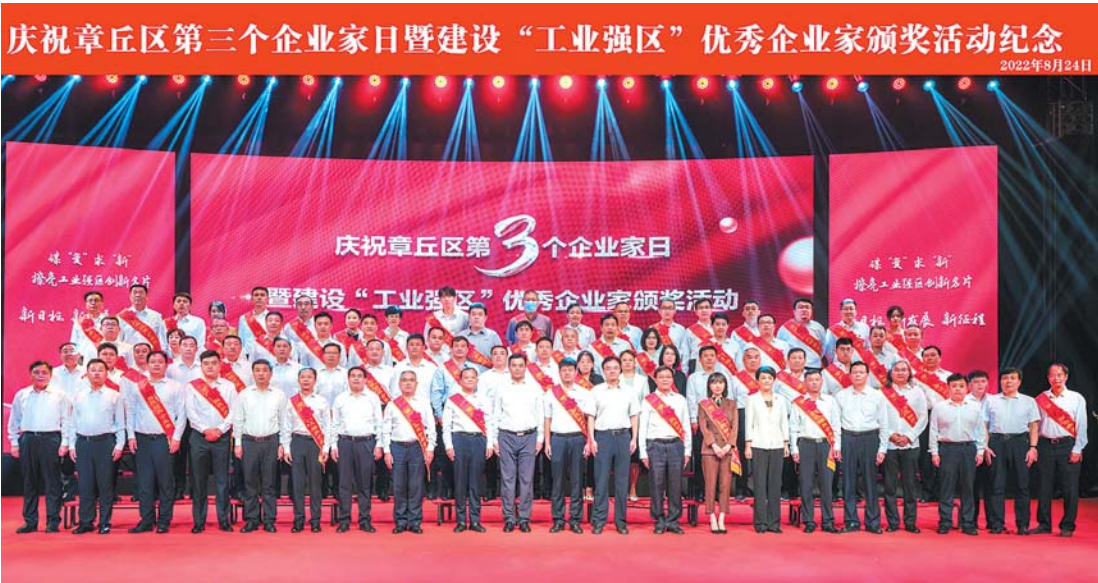
8月24日，庆祝章丘区第三个企业家日暨建设“工业强区”优秀企业家颁奖活动举行。

8月24日，庆祝章丘区第三个企业家日暨建设“工业强区”优秀企业家颁奖等系列活动举行。满满的仪式感、丰富的展销会，让企业家在充分感受到尊重与认可的同时，更把擦亮工业强区创新名片的紧迫感和使命感植入企业家的内心。 活动以“1+1+N”为主要内容，包括举办庆祝第三个企业家日暨建设“工业强区”优秀企业家颁奖活动、优质工业产品展销会暨产销供需对接会、一场战略合作签约仪式，举办N场产业发展论坛。