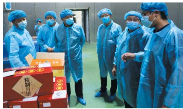
长清区开展月饼市场专项检查。

下一步,长清区市场监管局将持续关注月饼市场价格动态,加强中秋节前价格监管,倡导绿色消费理念,弘扬传统节日文化。