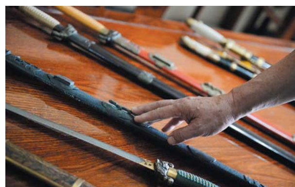
修复每一件古兵器前,他都要经过深思熟虑,寻求最佳修复方案。