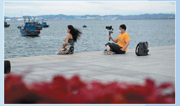
海源公园。