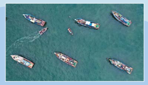
海源公园