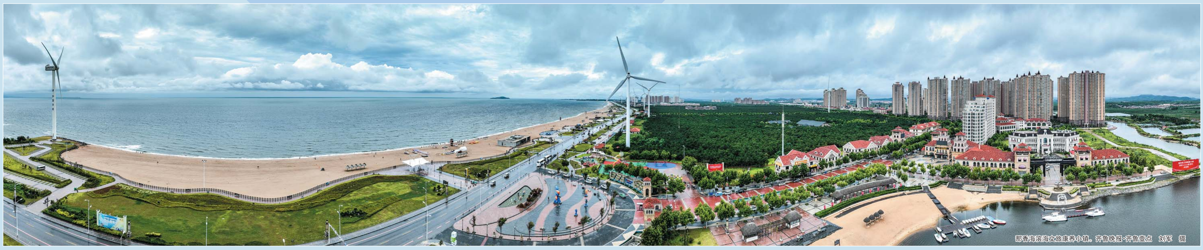
那香海滨海文旅康养小镇。