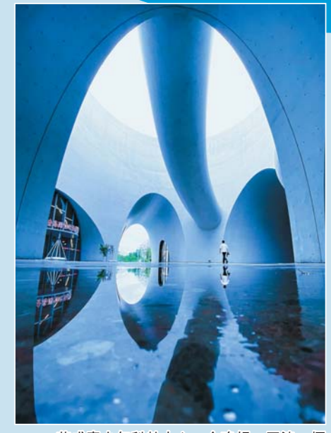
荣成青少年科教中心。