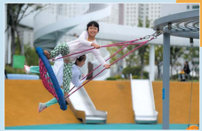
金线顶公园