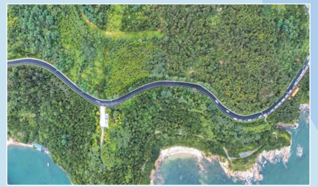
千里山海自驾旅游公路。