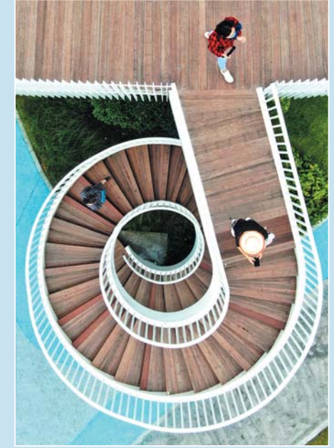
金线顶公园。