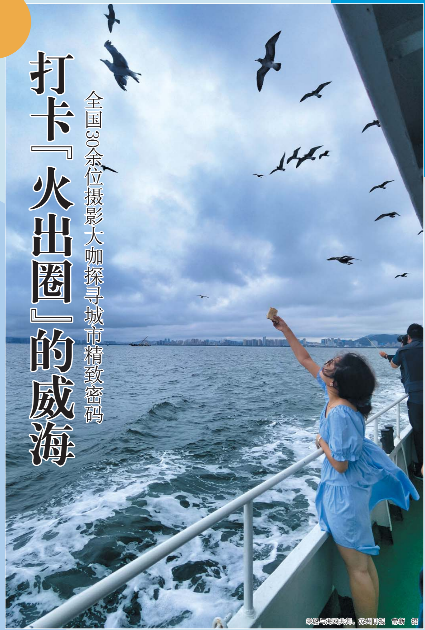
乘船与海鸥共舞。苏州日报 常新 摄