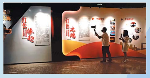
红色物业党建基地。