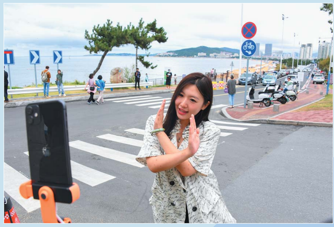
火炬八街。