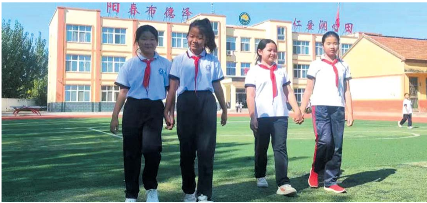
教师交流轮岗最大的受益者是学生。在高青县唐坊学区孙集小学,从一开始的胆怯到如今的阳光开朗,发生在孩子们身上的变化正一点点显现出来。