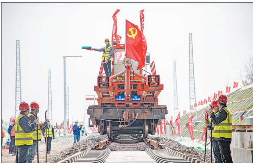
2022年3月31日，济莱高铁铺轨正式启动。