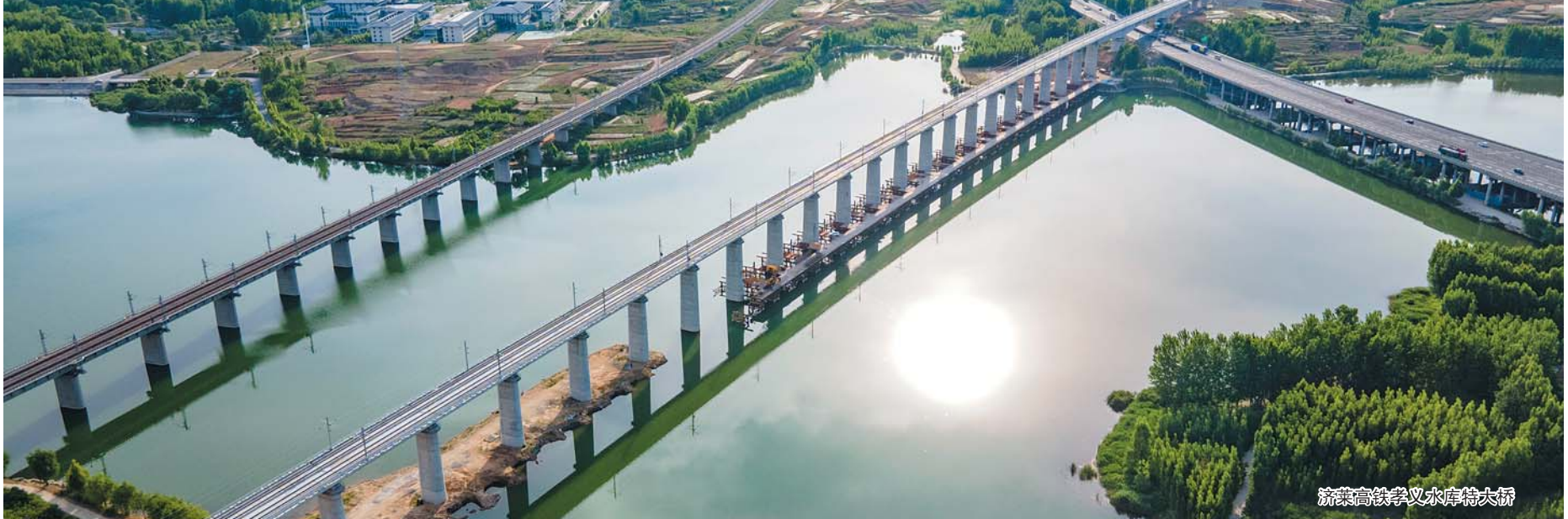
济莱高铁孝义水库特大桥