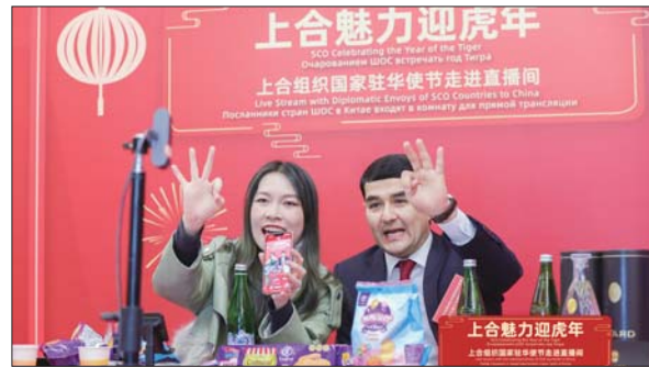
上合组织国家驻华使节走进直播间。