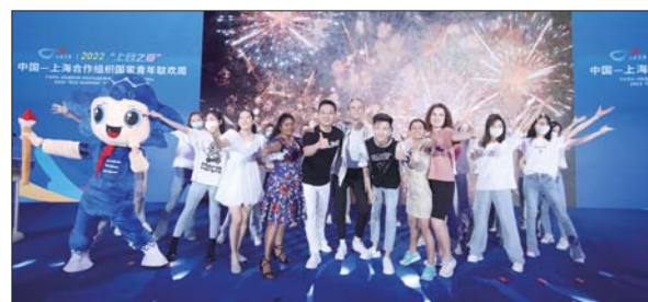
2022“上合之夏”中国—上海合作组织国家青年联欢周启动仪式。