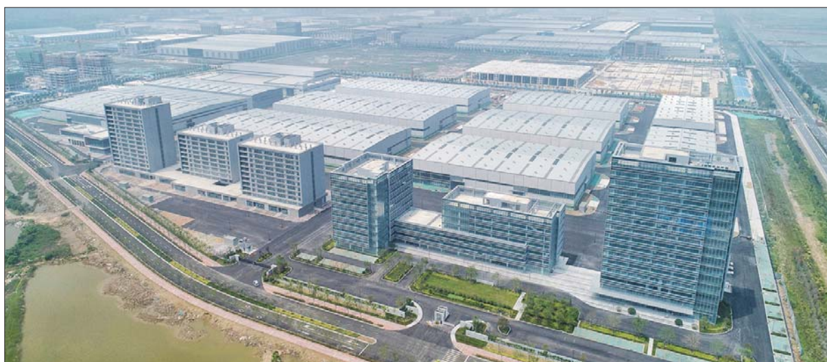
位于上合示范区核心区的上海电气风电装备产业园。

报料电话:(0531)85193700 13869196706 欢迎下载齐鲁壹点 600多位在线记者等你报料