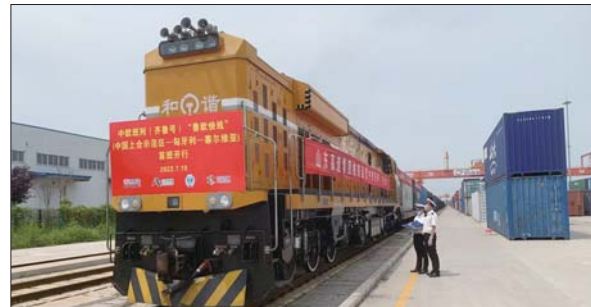
中欧班列(齐鲁号)“鲁欧快线”(上合示范区—匈牙利—塞尔维亚)首班开行。