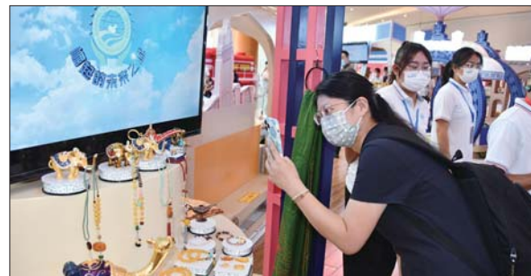
上合贸易展销活动。