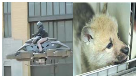
▲会飞的自行车 ▲克隆北极狼

在美国底特律车展上,由日本一家初创企业研发、世界上第一辆会飞的悬浮自行车首次亮相。据了解,这款车可以飞行40分钟,速度可达每小时100公里。目前这款飞行自行车已经在日本上市,在美国将销售一款体型更小的版本,预售价约为77.7万美元(约合人民币540万元)。