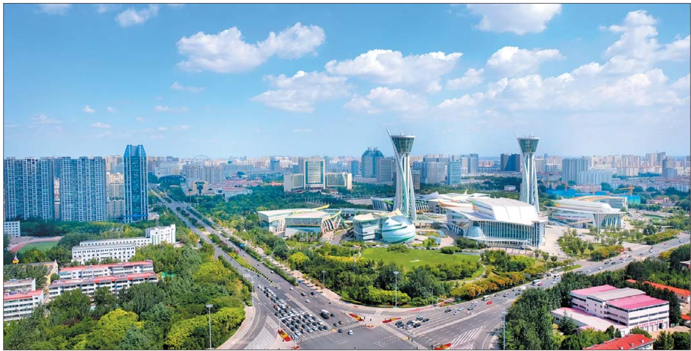
潍坊市政府广场远景。

现在的潍坊，正在以更高昂的激情和热情，朝着“万亿俱乐部”的目标阔步前行，奋勇前进。