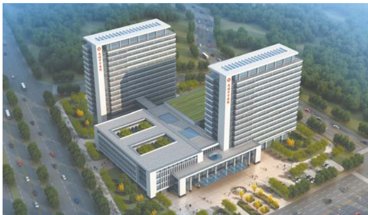
禹城市中医院新院区正在建设中, 图为新院区效果图。

通过住院电子病历、住院护理系统,大力提升临床医护人员工作效率。通过建立临床路径系统,规范医疗行为,提高医院临床诊疗的效率和质量;以服务临床管理为抓手,通过建设住院手术系统、手术麻醉系统规范手术流程;通过建设