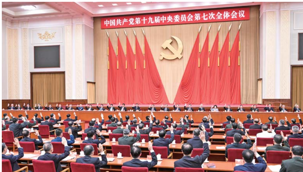
中国共产党第十九届中央委员会第七次全体会议，10月9日至12日在北京举行。中央政治局主持会议。