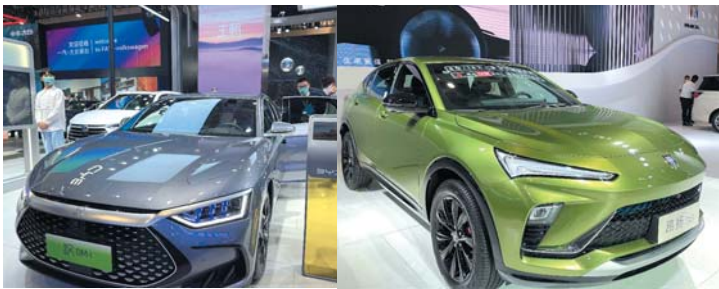
多款新车亮相齐鲁国际车展。

11月3日,2022齐鲁国际车展(秋季)暨第46届齐鲁国际汽车展览交易会在山东国际会展中心正式拉开帷幕。本届车展,奔驰全新EQE、东风日产ARIYA艾睿雅、哈弗第三代H6DHT-PHEV、比亚迪海豹等重磅新车集体亮相。透过这些新车,既可以感受当下新能源市场的火爆,无论是先行者,还是追赶者都在抢抓机遇谋求增量,又可以看到燃油车品牌正在通过消费群体细分,发力年轻化、家庭化来守卫市场份额。