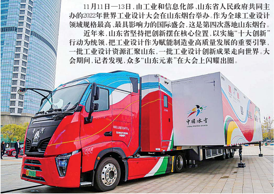
雪蜡车夺得中国优秀工业设计奖金奖。

今冬也是羽绒服新国标实施的首个旺季，记者在部分实体店发现，店内销售的羽绒服吊牌大部分已经没有“含绒量”的标注，只有“绒子含量”，少部分商家既标注了“含绒量”又标注了“绒子含量”。