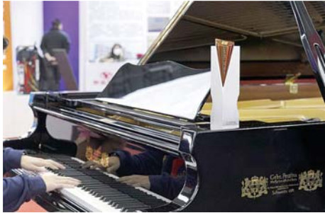
获铜奖的GBT217大型专业演奏用三角钢琴