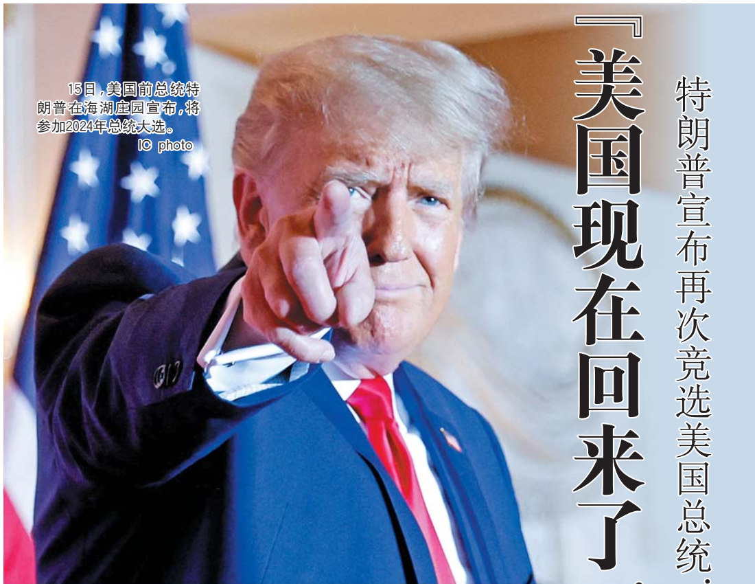
15日，美国前总统特朗普在海湖庄园宣布，将参加2024年总统大选。

特朗普现年76岁，曾三次竞选总统：2000年，他短暂参加改革党预选后退出；2016年以共和党人身份成功当选；2020年竞选连