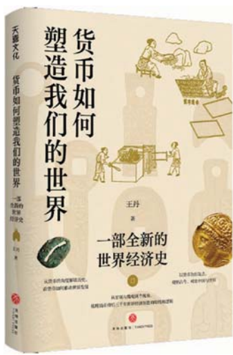
《货币如何塑造我们的世界：一部全新的世界经济史》 王莽 著 天地出版社

居摄二年(7年)，王莽开始了第一次币制改革。他铸造了大泉五十、契刀五百和金错刀三种货币，与五铢钱一起流通。原本刀币早已退出历史舞台，圆形方孔币成为主流，而