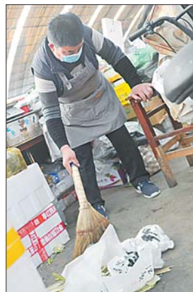
别人的菜摊打扫卫生都是菜叶子，他的菜摊多是练字的废纸。