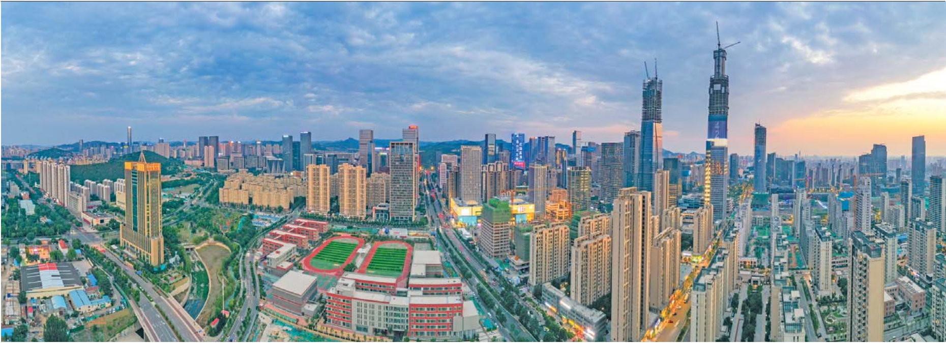
雄姿 2022年6月摄于济南中央商务区