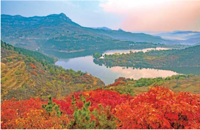
百丈崖水库之秋 2016年10月摄于济南章丘百丈崖水库