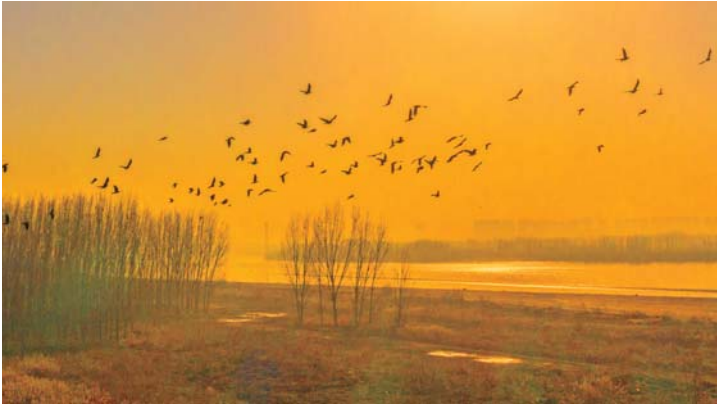
黄河暮归 2021年12月摄于济南黄河槐荫段