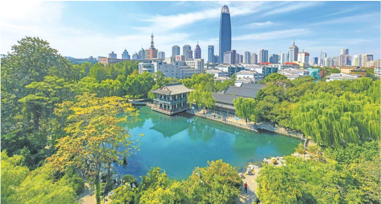
五龙潭 2022年9月摄于济南五龙潭公园

我自幼喜欢绘画与剪纸,一个偶然的机会接触到了相机,对其能够把人与物照出影像产生了浓厚兴趣,也在我幼小的心里种下拥有自己相机的种子。 上世纪80年代,在我上军校的第一年,我硬是从每月25元的津贴里抠出了200元,把一台海鸥相机抱在了怀里。 用这部相机,我拍摄战友们学习和训练,留下了很多有纪念意义的照片。那时并不懂构图与用光,只是记录而已。后来通过不断学习和交流提升了我对摄影的认知,从见啥拍啥到有的放矢,而且开始痴迷于风光摄影。 山泉湖河城是济南的名片,更是我身边的美景,于是从2016年我开始了针对性的拍摄。 这些照片只是山泉湖河城的一部分,为了拍出更出彩的作品,我总是反复拍摄反复比对,有些地方要去拍一二十次才满意。拍摄需要跋山涉水、忍饥挨饿,有时累得苦不堪言,但每每拍到了自己得意的作品,那一切劳顿都烟消云散。 我会继续在拍摄道路上开拓前进,用镜头诠释济南的名片。