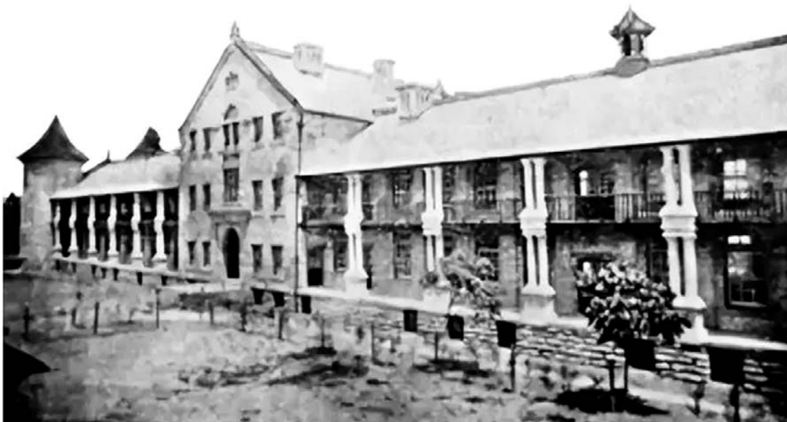
济南第一家西医院华美医院。

开设中西医结合医院的要求显然就更高了,首先要克服的不是技术层面的问题,而是中西医思想的隔阂与观念的疏离,首先破局的是山东巡抚袁世凯。1899年12月袁世凯署理山东巡抚,1900年在济南五龙潭潭西精舍旧址,创办了山东省抚部院官立中西医院,由于是巡抚亲自倡导创办,所以才有了这个读起来有些拗口的名字,史实文献中多以简称“山东官立中西医院”代替。山东官立中西医院设中西两个药房,打破了中西医不兼容的尴尬局面,这被认为是近代中国最早的官立中西医结合医院(一说中国最早的中西医结合医院是1909年上海中医李平书创办的上海医院,数年后停办。)山东官立中西医院的