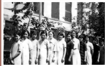
穿着旗袍和连衣裙的医院职工。

1904年济南自主开埠通商后,济南很快成为华北商贸中心,医药业与其他产业一起壮大起来,短时间内“药肆林立”。1900年山东官立中西医院的开办,创造了近代山东医药卫生史上多个第一:山东最早的官办医院、山东最早的中西医结合医院、山东最早使用现代病历的医院……在多个方面开创了山东乃至全国中西医结合的先例。