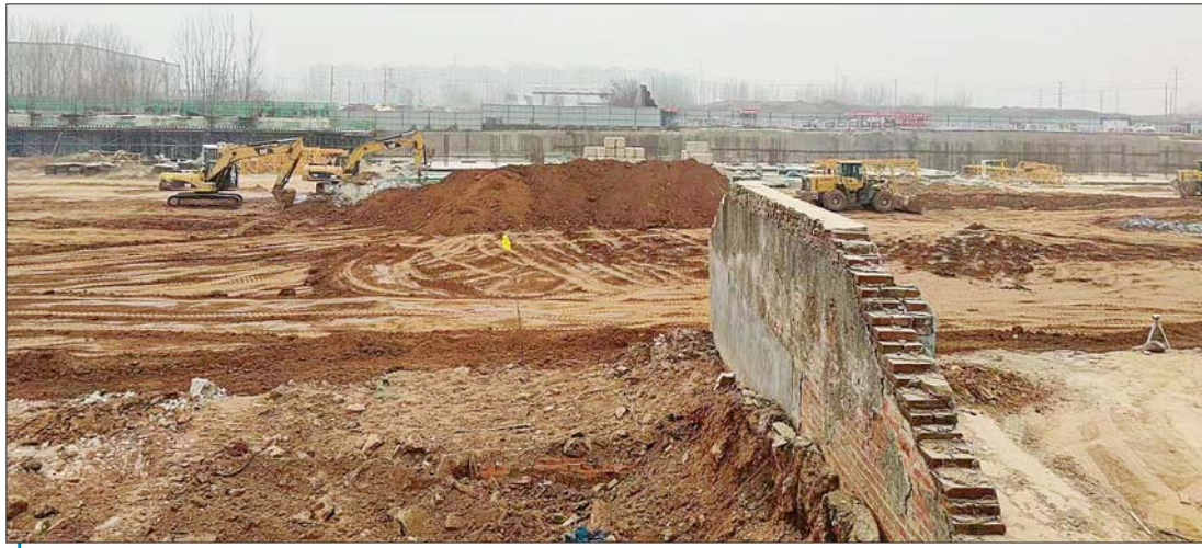
27日,记者现场探访壹粉新房所在工地多是大坑和裸土,仅看到一栋楼刚出正负零。